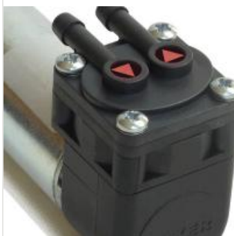
pompe a membrana per gas